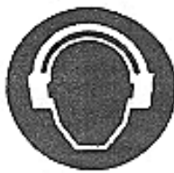
Protezione obbligatoria dell'udito