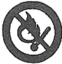
Vietato Fumare o usare fiamme libere