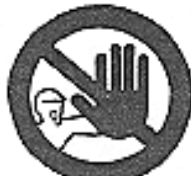
Divieto di accesso alle persone non autorizzate