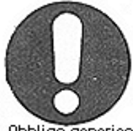
Obbligo generico ( con eventuale cartello supplementare )