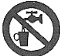
Acqua non potabile