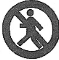
Vietato ai pedoni