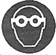
Protezione obbligatoria degli occhi