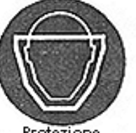
Protezione obbligatoria del viso