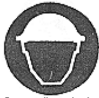
Casco di protezione obbligatorio