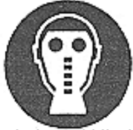
Protezione obbligatoria delle vie respiratorie