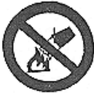
Divieto di spegnere con acqua