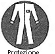
Protezione obbligatoria del corpo