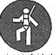
Protezione individuale obbligatoria contro le cadute