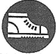
Calzature di sicurezza obbligatorie