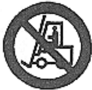
Vietato ai carrelli di movimentazione