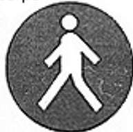
Passaggio obbligatorio per i pedoni