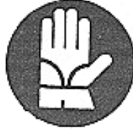
Guanti di protezione obbligatoria